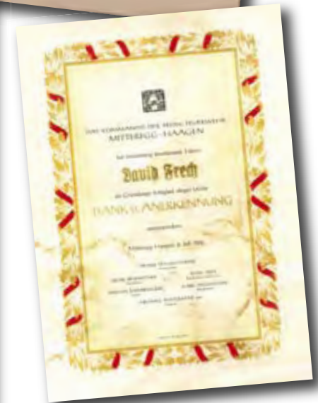
Urkunde für Gründungsmitglieder anlässlich der 50-Jahr-Feier